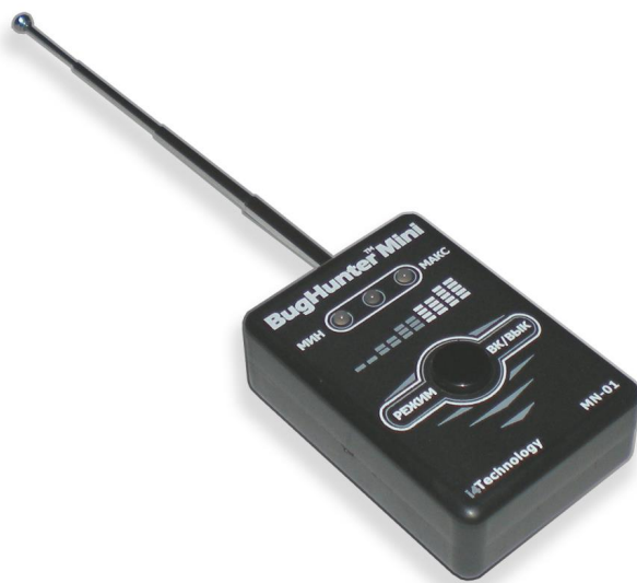
Рисунок 1 – внешний вид изделия

1.2.1 Внешний вид изделия представлен на рисунке 1