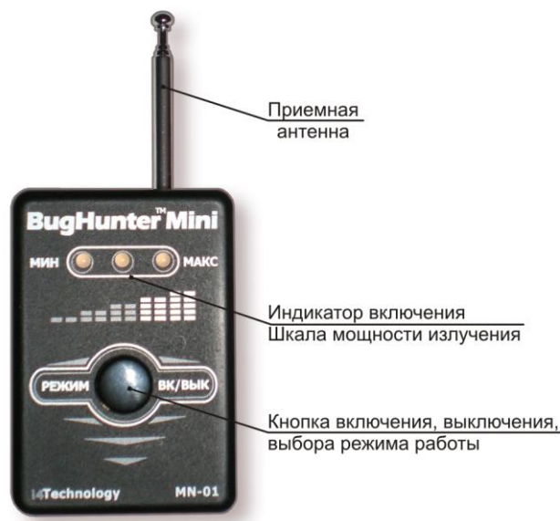
Рисунок 2 – расположение основных частей изделия

1.3.2 Расположение основных частей изделия представлено на рисунке 2.