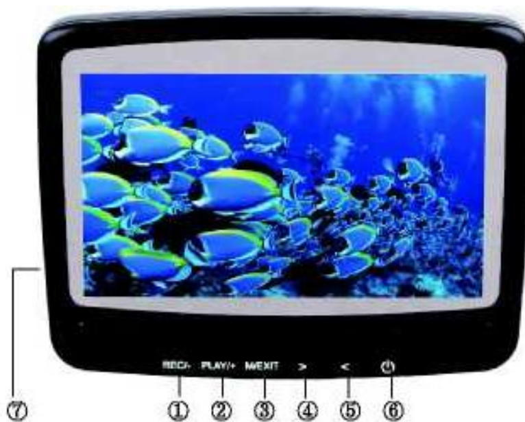
Схема устройства, назначение кнопок